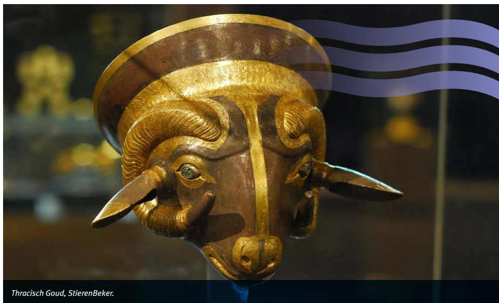
Thracisch Goud, StierenBeker.

dien een cultuur die zowel de invloeden van het Middellandse Zeegebied als van Klein-Azië, en zelfs van noordelijk Europa, heeft geabsorbeerd. Van het bestaan van de Thraciërs wordt in de literatuur voor het eerst mel-