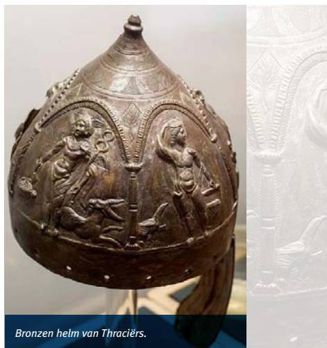
Bronzen helm van Thraciërs.

ding gemaakt door Griekse schrijvers, zoals Homerus, Herodotus en Euripides. Volgens hen bewoonden de Thraciërs het naar hen genoemde gebied aan de Zwarte Zee al tussen 1600 en 1200 voor onze jaartelling. De Thraciërs vochten in elk geval mee in de oorlog om Troje, zij het aan de verkeerde kant, die van de verliezers, de Trojanen.