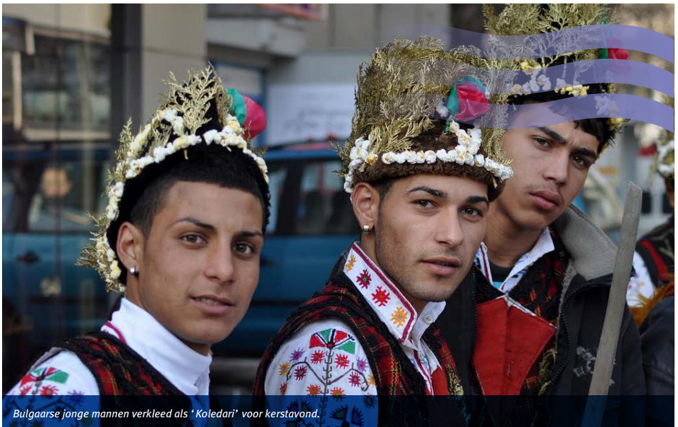
Bulgaarse jonge mannen verkleed als 'Koledari' voor kerstavond.

Op 25 december bezoeken familieleden en vrienden elkaar. Kinderen en volwassenen geven elkaar geschenken. De jongsten geloven dat de kerstman cadeautjes achterlaat onder de kerstboom. Later op kerstdag maken Bulgaren meestal grote diners met vlees voor