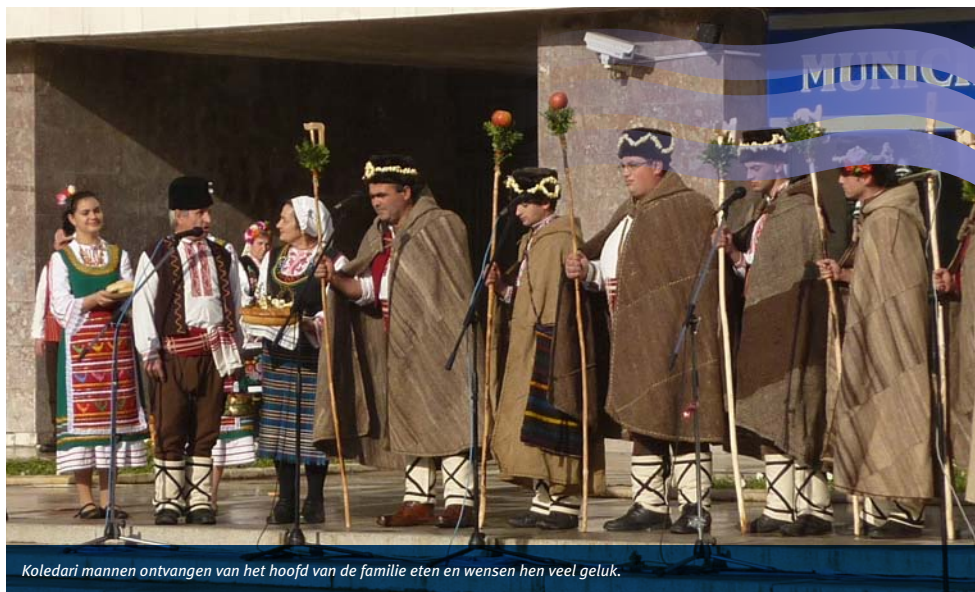
Koledari mannen ontvangen van het hoofd van de familie eten en wensen hen veel geluk.

familie en vrienden. Eten en drinken delen is een belangrijk onderdeel van de Bulgaarse cultuur en wordt beschouwd als een manier van respect tonen.