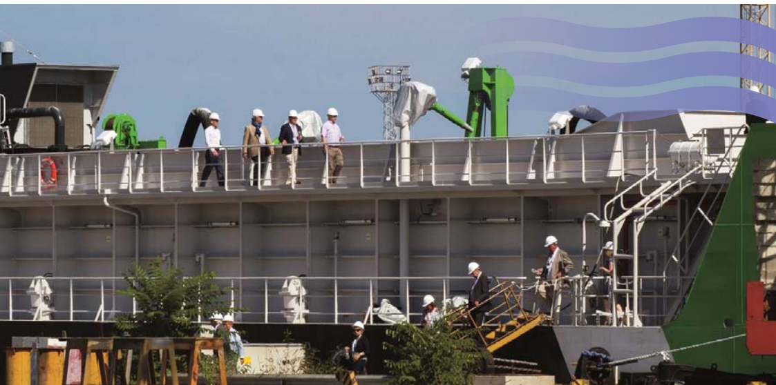
Delegatie neemt een kijkje aan boord van een schip bij scheepswerf Dolphin in Varna.

Een van de vragen was hoe maritieme en tech-