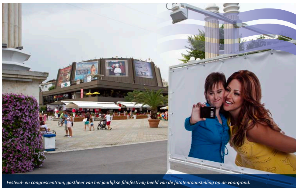
Festival- en congressentrum, gastheer van het jaarlijkse filmfestival; beeld van de fototentoonstelling op de voorgrond.