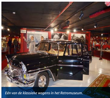
Eén van de klassieke wagens in het Retromuseum.

Dit museum raden inwoners van Varna aan. Het is sinds kort geopend en geeft een kijkje in het Communistische verleden van Bulgarije in de