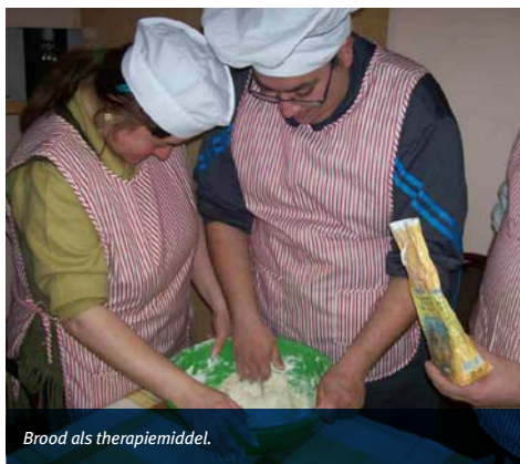
Brood als therapiemiddel.