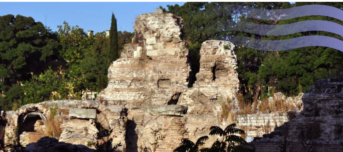
De ruïnes van Romeinse thermen (2000 n. Chr.) bij het Archeologisch Museum. Het badencomplex was ooit de grootste van de hele Balkan (7000 m 2 ).