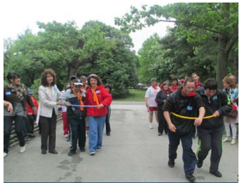
Het personeel sport veel met de inwoners