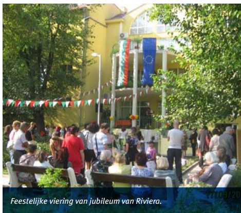
Feestelijke viering van jubileum van Riviera.