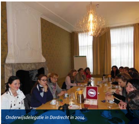
Onderwijsdelegatie in Dordrecht in 2014.

Er is plaats voor acht bedrijven uit de maritieme sector van de Drechtsteden om mee te gaan met dit bezoek. Daarnaast zal het